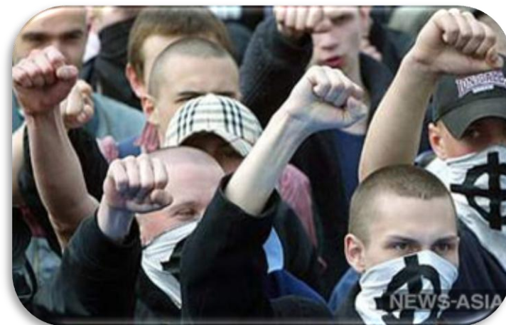
В Костроме скинхеды напали на неформалов